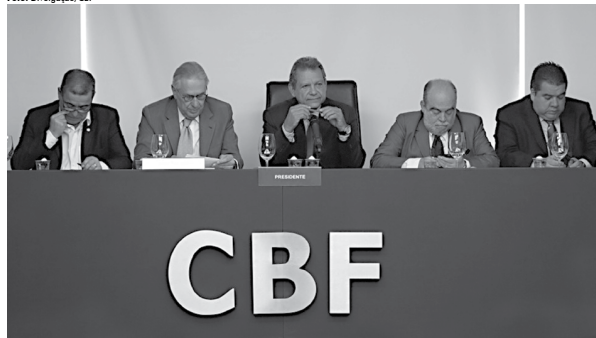
Comissão que formulou o estatuto da CBF que manteve a cláusula de barreira no lançamento de candidatura à presidência.

As 27 federações estaduais aprovaram ontem, em assembleia, o novo estatuto da CBF. O documento foi reformado após discussão no Comitê de Reformas, mas não traz uma mudança no cenário do poder do futebol nacional. Apesar de o colégio eleitoral ter sido aumentado, com a inclusão dos clubes das Séries A e B do Brasileiro, as federações continuarão a ter peso maior na votação.