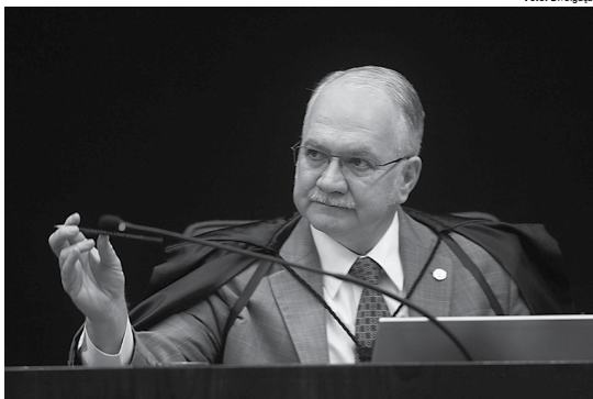
Edson Fachin já havia autorizado interrogatórios no mês de fevereiro, mas só agora eles foram encaminhados

Advogado O ministro deixou indefinido, entretanto, o cumprimento de uma terceira medida que havia autorizado em fevereiro, a pedido da PGR: que fosse apurado no STF todos os registros de acesso do advogado Eduar-