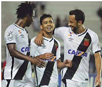
Jogadores do Vasco comemoram a vitória após a vitória contra o Flamengo.

grandes valem três pontos como valem os outros. A importância do jogo é grande porque queremos ganhar. É importante os jogadores