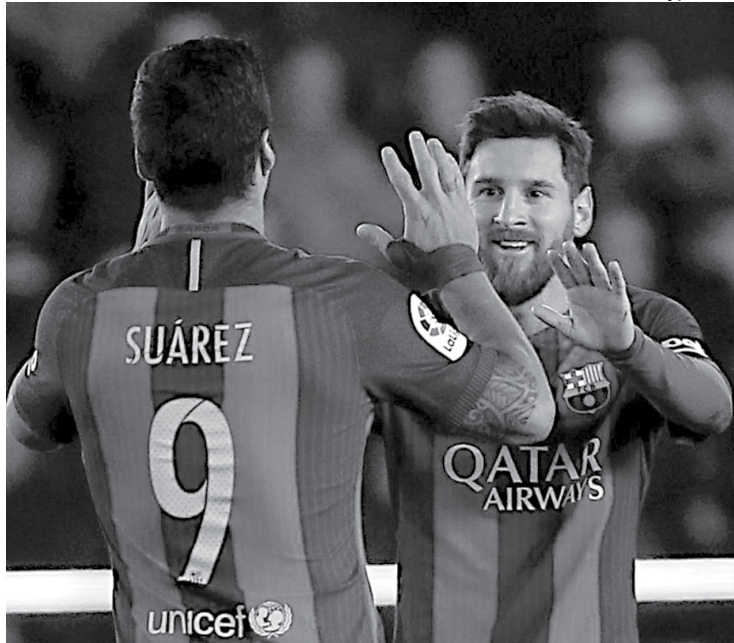
Messi e Suárez, uma dupla que tem feito muito gols, são a camisa do Barcelona Argentino que mais se destaca no clube para a renovação.

A cadeia espanhola afirma que esta foi a segunda oferta dos Red Devils por Mbappé. Depois de ter recusado uma proposta de € 80 milhões (R$ 264 milhões), o clube inglês teria subido o valor em um encontro em Manchester no dia 21 de fevereiro, aproveitando a visita dos monegascos à cidade para o duelo contra o Manchester City.