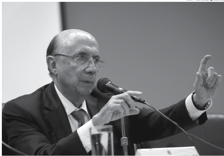
Ministro Henrique Meirelles destacou que estão sendo verificadas as receitas que podem diminuir a necessidade de aumento de impostos

Questionado se a votação apertada para a aprovação do projeto de terceirização da mão de obra pode indicar dificuldades para a reforma da